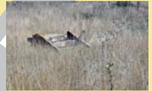
Vestiges : Drac Pays de la Loire/Bernard Renoux Camp internement Montreuil-Bellay : Archives Jacques Sigot / CRRL

>>> À Sciences Po, 49 place Charles de Gaulle, Poitiers